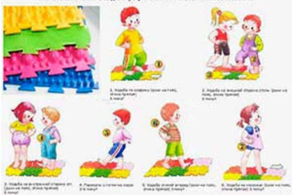
Начальный комплекс для профилактики и лечения плоскостопия

Тьютор, МКДОУ «Детский сад № 1», г.Железногорск Курская область